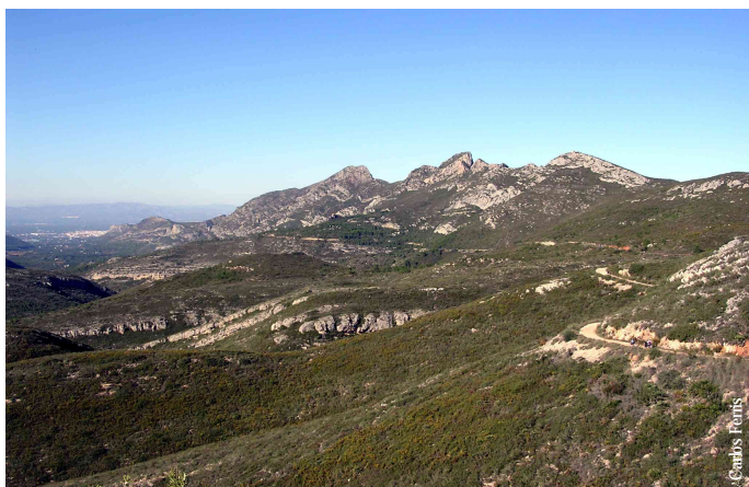
Valle de la Casella