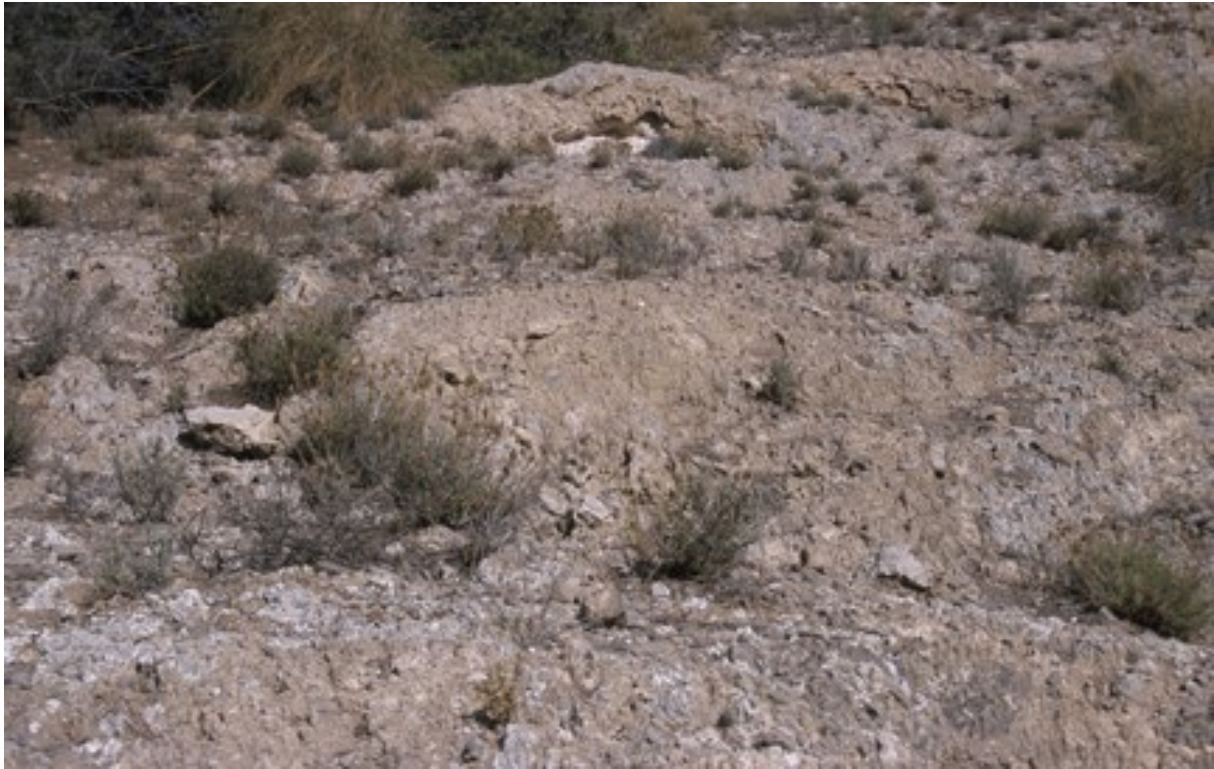
Vista de la microreserva en la qual s'observen les comunitats de gipsòfits.