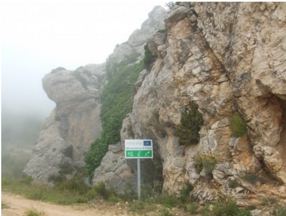
Vista de la microreserva en la que se observan las comunidades de especies rupícolas

http://www.dogv.gva.es/datos/2001/01/30/pdf/2001_670.pdf