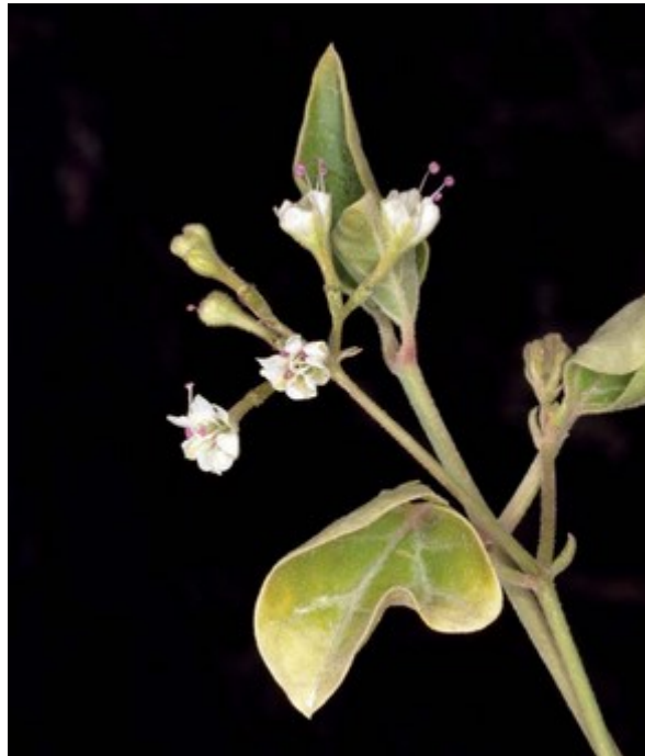
Boerhavia repens (esquerra) i Commicarpus africanus (dreta) són dos arbustos prostrats d'òptim nord-africà que colonitzen clivells i peus de penyals seques i assolellades.