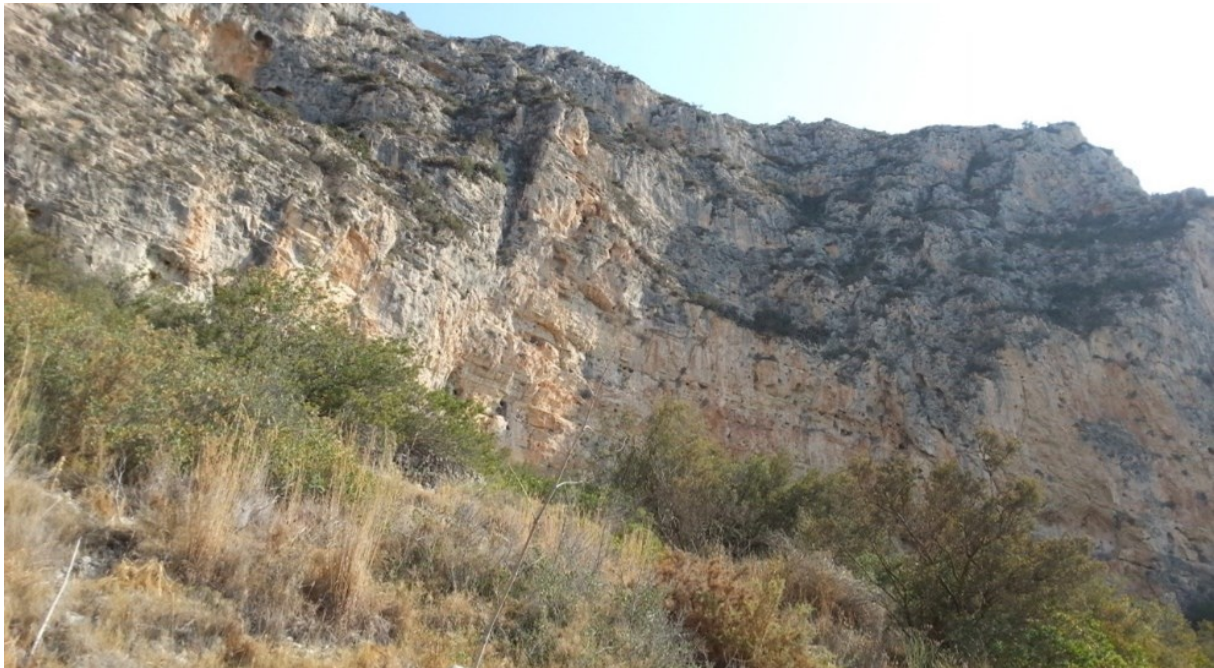
Vista de la microreserva en la qual s'observen les comunitats vegetals que presenten les espècies rupícoles.

http://www.dogv.gva.es/datos/2010/06/10/pdf/2010_6390.pdf