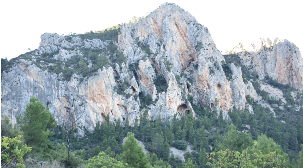
Vista de la microreserva de flora en la que se observan las comunidades de especies rupícolas y fragmentos del encinar.