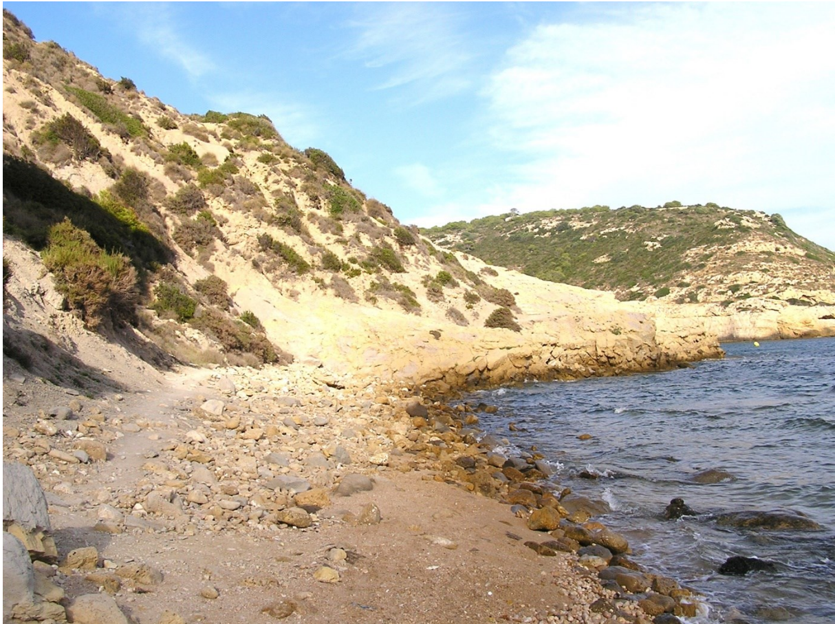
Vista de la microreserva, en la qual s'observen les comunitats de penya-segats litorals amb ensopegueres endèmiques.