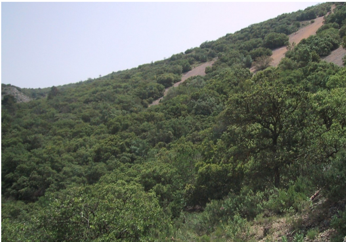
Vista de la microrreserva en la que se aprecia el encinar y las comunidades de canchales