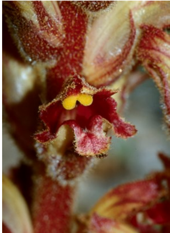
Cephalanthera rubra (izquierda) es una orquídea característica de encinares umbrosos, quejigales y bosques mixtos en buen estado de conservación. Orobanche gracilis (derecha) es una especie parásita de leguminosas leñosas de matorrales secos.