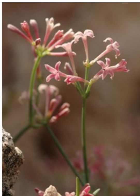
Silene hifacensis (izquierda) es una de las especies amenazadas valencianas más emblemáticas. Asperula pau i subsp. dianensis (derecha), es un endemismo diánico de las sierras litorales desde Denia al Mascarat.