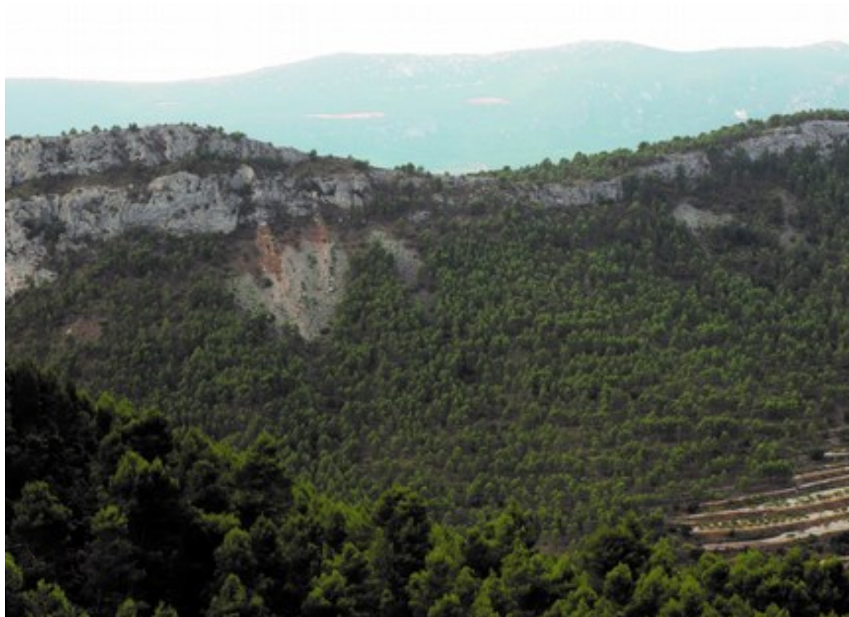
Vista del vessant nord de la microreserva.

http://www.dogv.gva.es/datos/2001/08/07/pdf/2001_7555.pdf