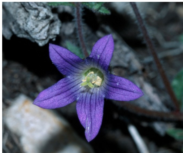
Endemismes iberollevantins que colonitzen parets verticals i extraploms: Sarcocapnos saetabensis (esquerra) i Campanula hispanica (dreta).