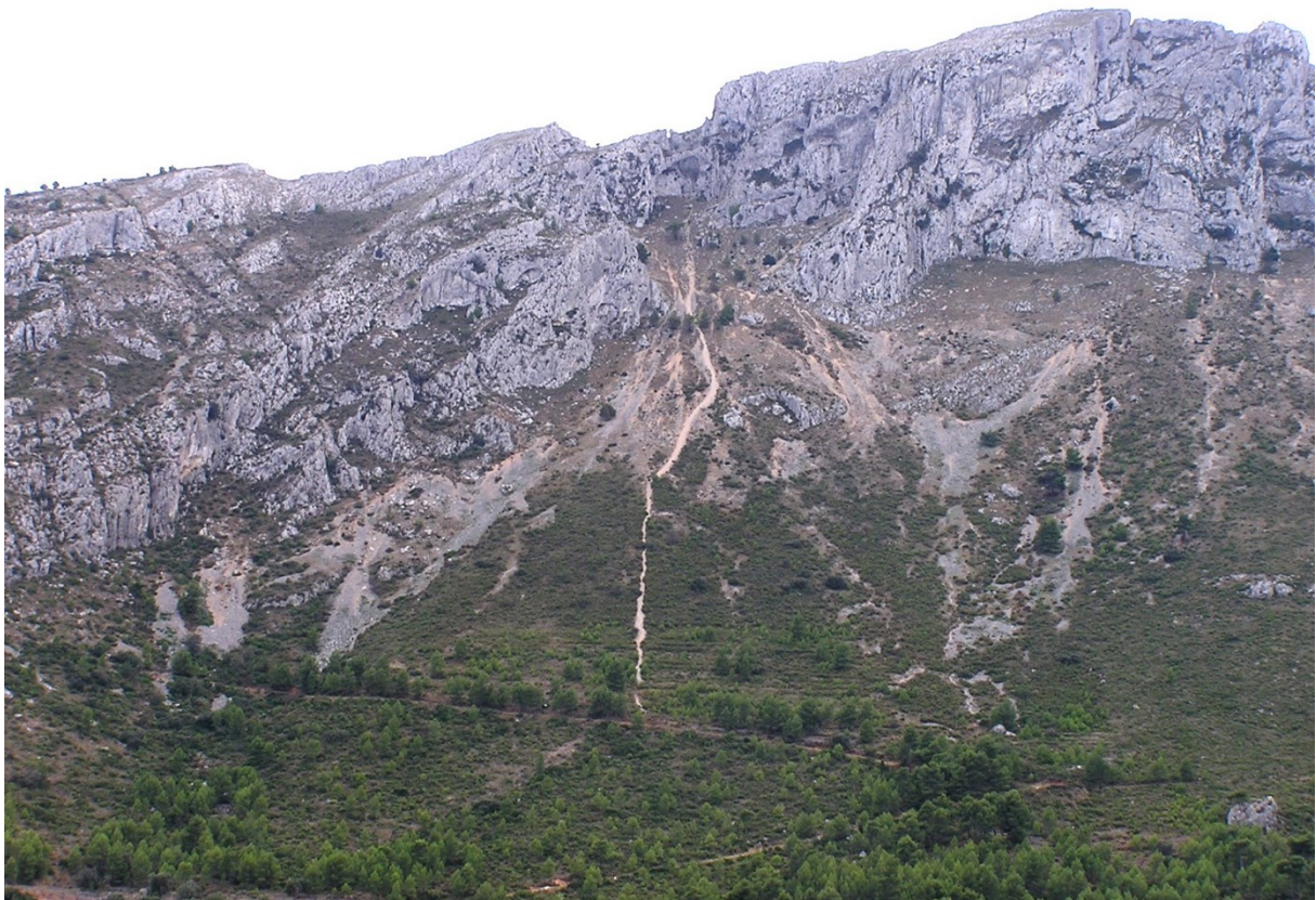
Vista de la microreserva en la qual s'observen les comunitats rupícoles i les pròpies de runars.

http://www.dogv.gva.es/datos/2001/01/30/pdf/2001_670.pdf