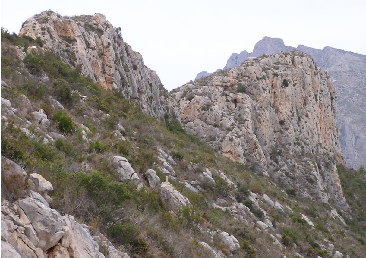
Vista dels cingles on hi ha les comunitats d'espècies rupícoles.

http://www.dogv.gva.es/datos/2001/08/07/pdf/2001_7555.pdf