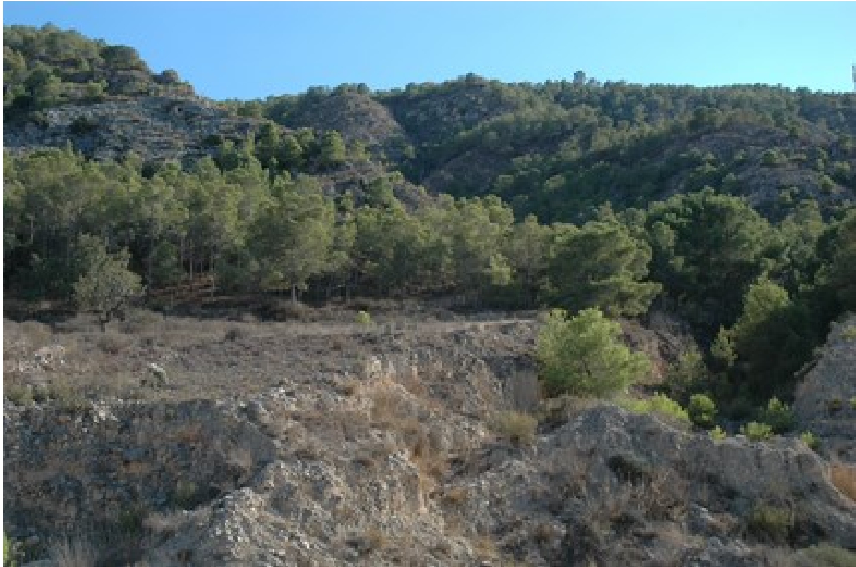
Vista de les comunitats rupícoles i de matollar.