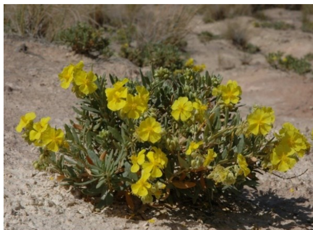
Dues de les espècies més característiques de les comunitats vegetals sobre algeps (gipsòfits): Teucrium libanitis (esquerra) i Helianthemum squamatum (dreta).