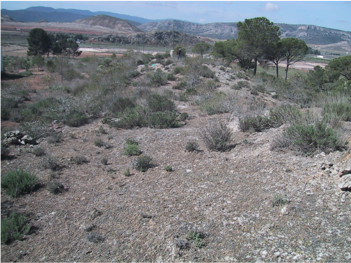
Vista de la microreserva, en la qual s'observa la comunitat d'espècies gipsòfiles.