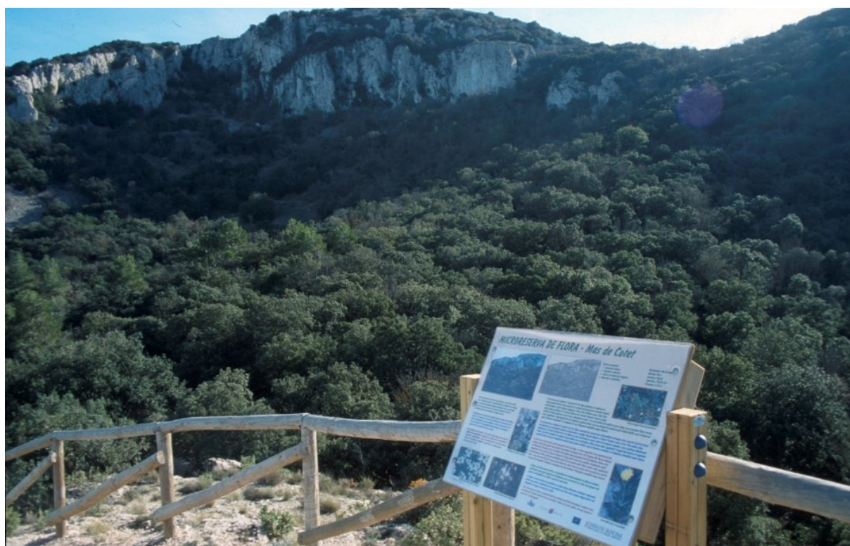
Vista de la microreserva en la qual s'observen les comunitats d'espècies rupícules i les formacions de bosc mixt.