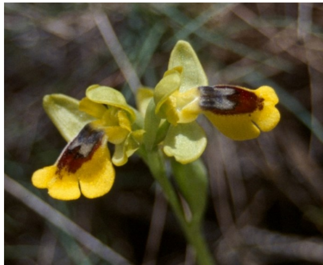
Dos de las orquídeas que encontramos en estos matorrales aclarados y pastizales: Ophrys incubacea (izquierda) y Ophrys lutea (arriba).

Tipos de hábitats (Código Natura 2000)(Hábitat prioritario*)