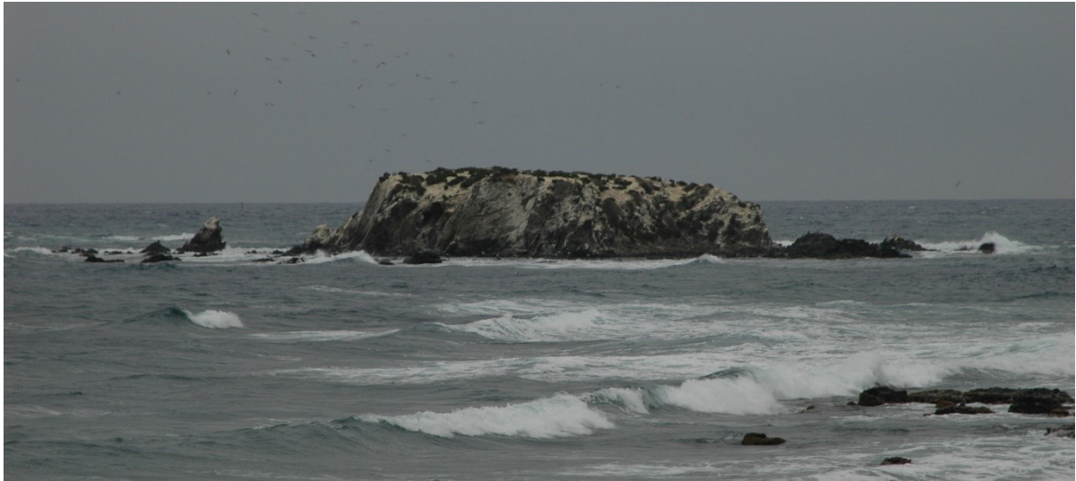
Vista de la microreserva des de l'extrem oriental de l'Illa Plana.