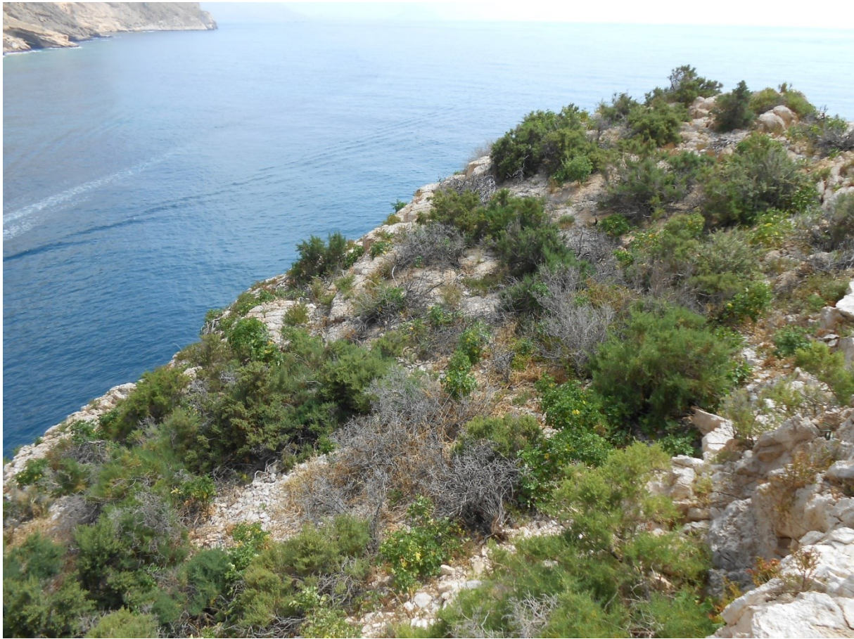
Vista de la microreserva en la qual s'observen les comunitats de matollars halonitròfils.