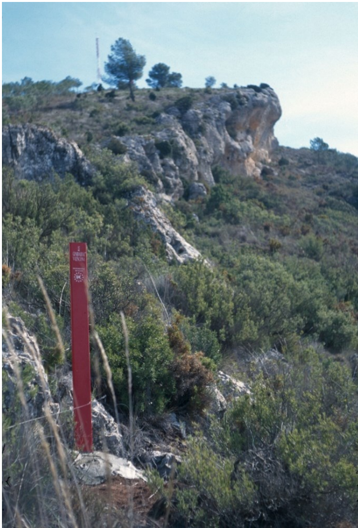
Vista de la microreserva, en la qual s'observen les comunitats rupícoles i de matollar.

http://www.dogv.gva.es/datos/1999/05/28/pdf/1999_4785.pdf