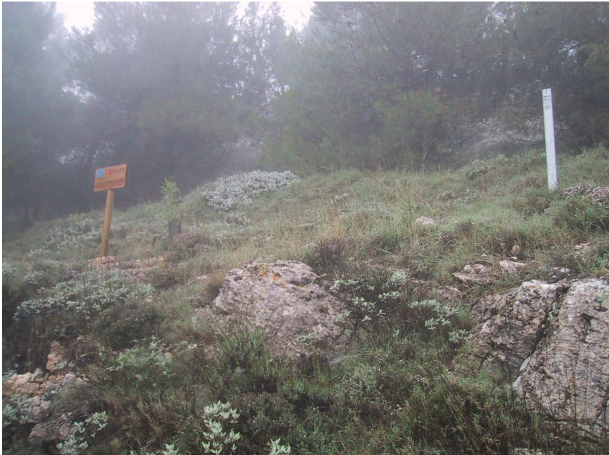
Vista de la microreserva, en la qual s'observa el salviar.

http://www.dogv.gva.es/datos/2001/01/30/pdf/2001_670.pdf