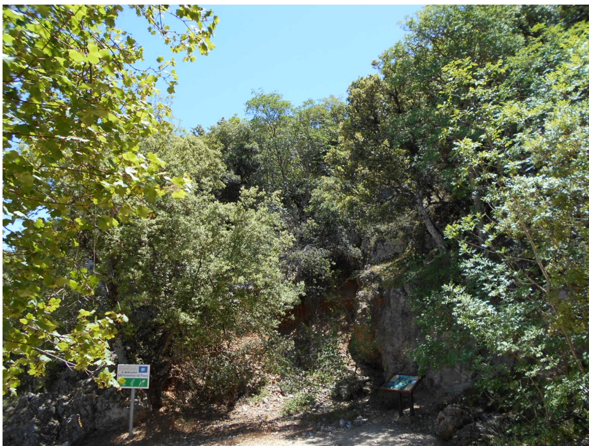
Vista de la microrreserva, en la que se observan las formaciones de bosques mixtos, encinares y robledales.