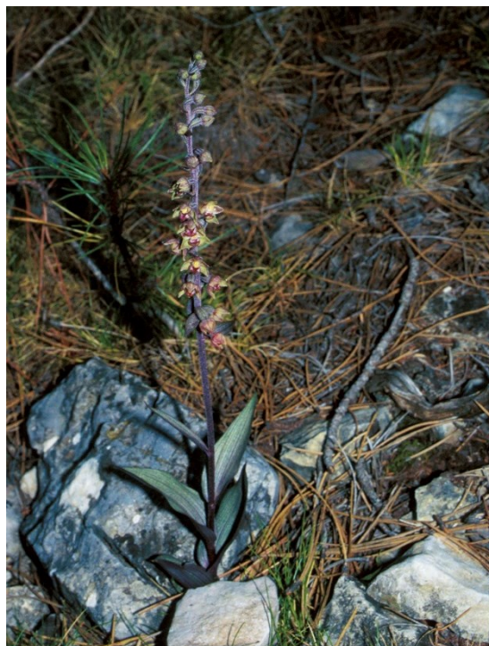
Dos especies de orquídeas del género Epipactis , propias de bosques maduros con una elevada humedad ambiental: Epipactis cardina (izquierda) y Epipactis kleinii (derecha).