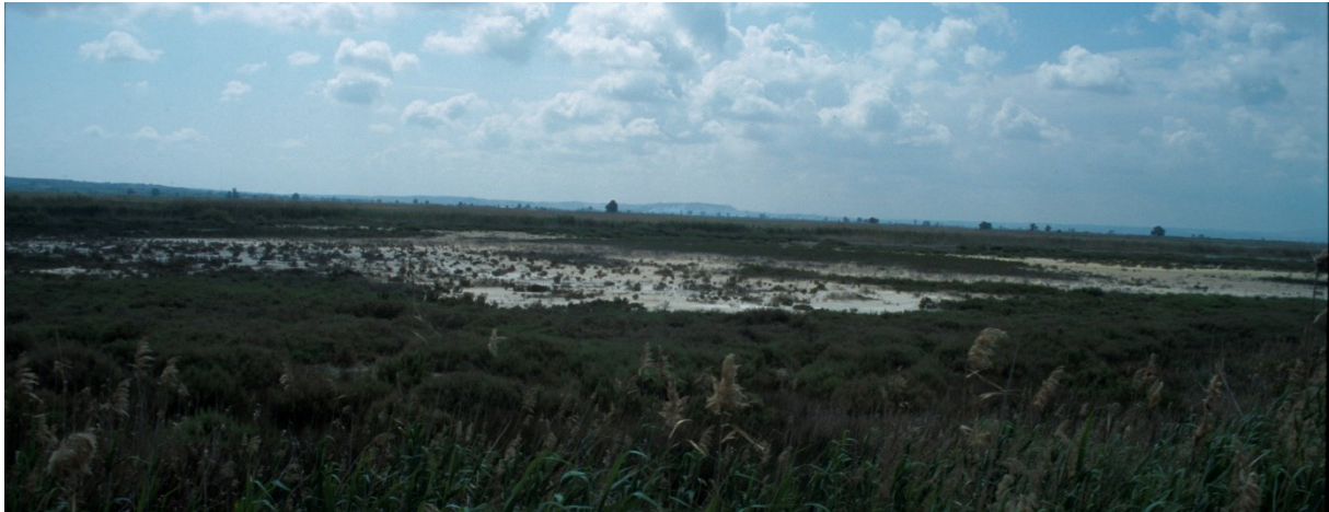
Vista de la microreserva parcialment inundada.