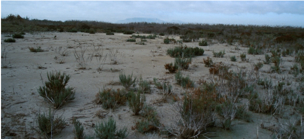
Vista de la microreserva, amb la llacuna en fase seca