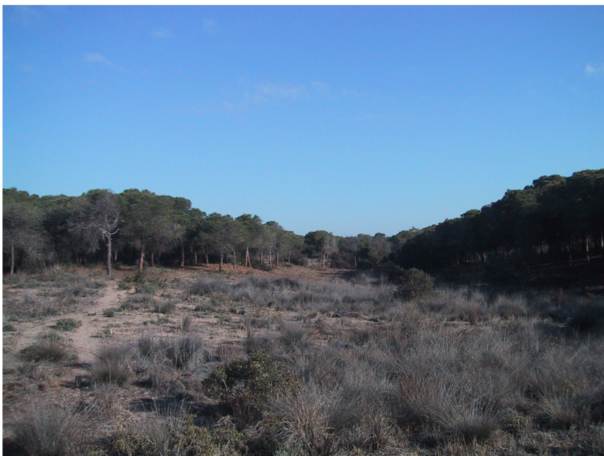
Vista de la microrreserva, en la que se pueden observar las comunidades psammófilas, de marjales intradunares y bosquetes de pinos.