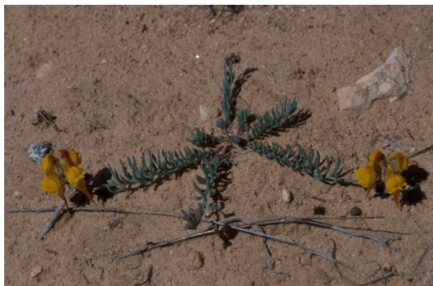
Dos de las especies más características de los ecosistemas dunares: Crucianella maritima (izquierda) y Linaria depauperata subsp. hegelmaieri (derecha).

Tipos de hábitats (Código Natura 2000)(Hábitat prioritario*)