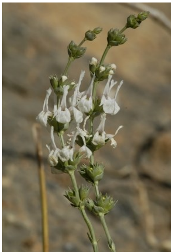
Notoceras bicornis (esquerra) forma part dels pradells anuals en ambients semiàrids i un poc nitrificats. Sideritis glauca (dreta) és un endemisme de les serres d'Oriola, Callosa de Segura i àrees limítrofes de Múrcia.