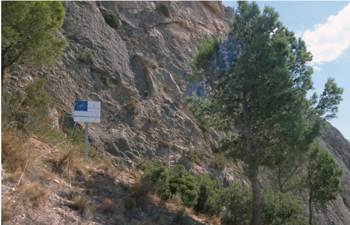
Vista de la microrreserva, en la que se observan las comunidades de especies rupícolas.

http://www.dogv.gva.es/datos/1999/05/28/pdf/1999_4785.pdf