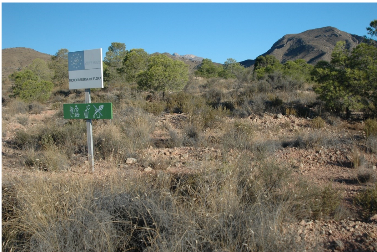
Vista de la microreserva, en la qual s'observen els espartars d'albardí i les comunitats de gipsòfits.