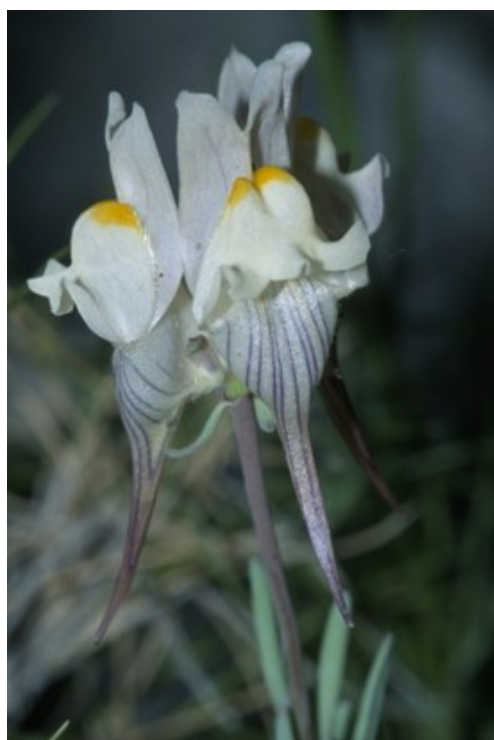
Festuca patula (esquerra), gramínia molt rara i escassa en el territori valencià. Linaria depauperata subsp. depauperata (dreta) és un endemisme del sector corològic Setabenc.