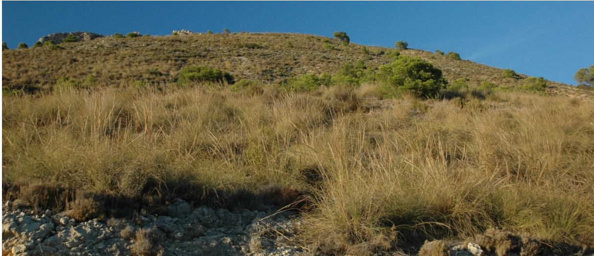
Vista de la microrreserva, donde se observan las formaciones dominadas por el esparto ( Stipa tenacissima ).

http://www.dogv.gva.es/datos/1999/05/28/pdf/1999_4785.pdf