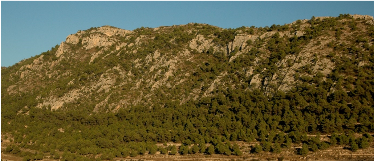
Vista de la microreserva, en la qual s'observen les comunitats d'espècies rupícoles i els fragments de carrascat/coscollar.