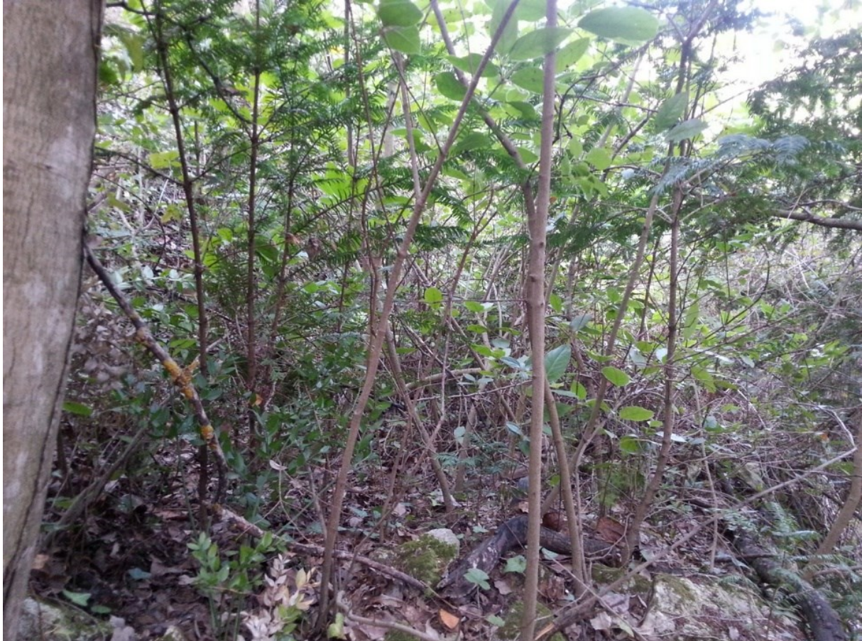
Vista de la microrreserva, donde se observan ejemplares de tejos de diferentes clases de edad.

http://www.dogv.gva.es/datos/2010/06/10/pdf/2010_6390.pdf