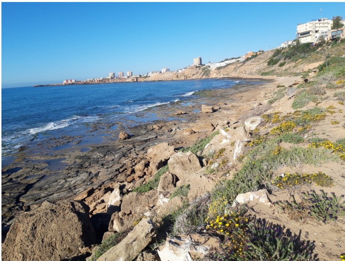
Vista de la microreserva en la qual s'observa la vegetació de penya-segats litorals amb ensopegueres ( Limonium sp. ) endèmiques.