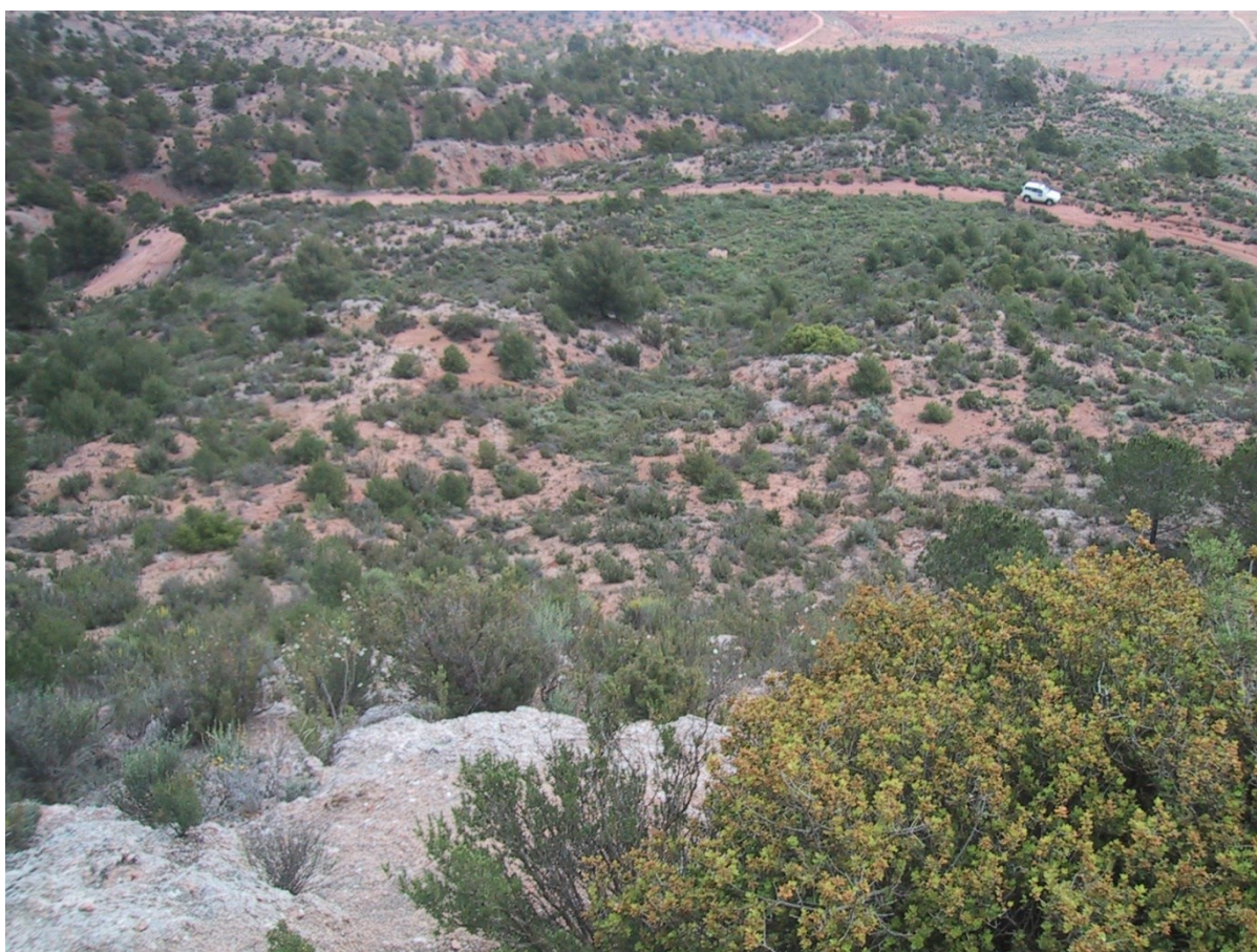
Vista de la microrreserva en la que se observan los suelos yesíferos con la presencia de especies gipsícolas.