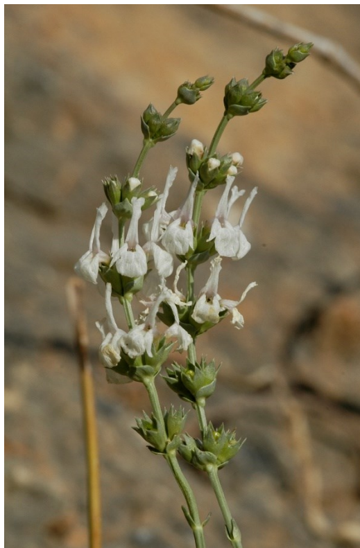
Sideritis glauca es un endemismo de las sierras de Orihuela, Callosa de Segura y áreas limítrofes de Murcia que también crece en ambientes rupícolas.