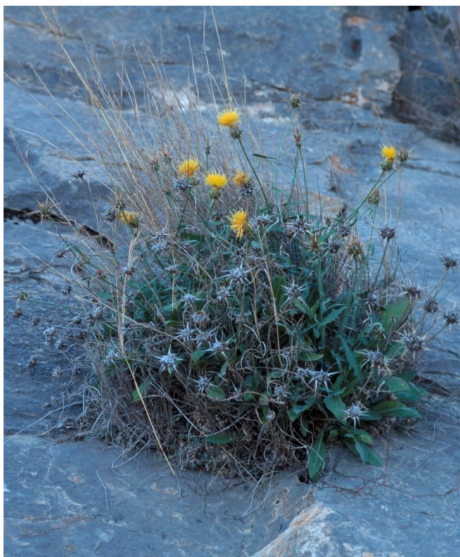
Centaurea saxicola es una especie característica de esta microrreserva, que coloniza los roquedos.

Teucrium buxifolium subsp. rivasii (E, R)