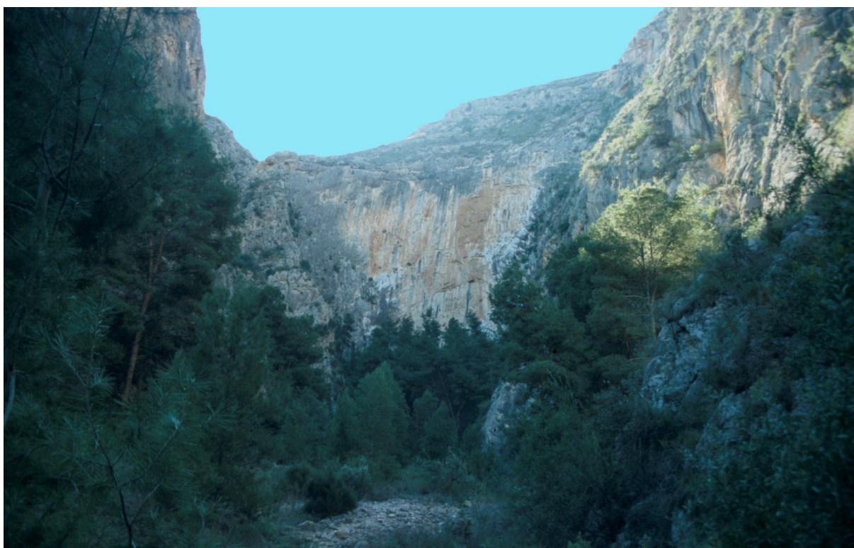
Vista de la microrreserva en la que se observan los ambientes rupícolas y las formaciones de matorral.

http://www.dogv.gva.es/datos/2005/11/03/pdf/2005_12039.pdf