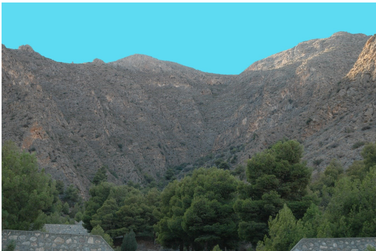
Vista de la microreserva en la qual s'observen els ambients rupícoles i les fàcies del cornical

http://www.dogv.gva.es/datos/2001/08/07/pdf/2001_7555.pdf