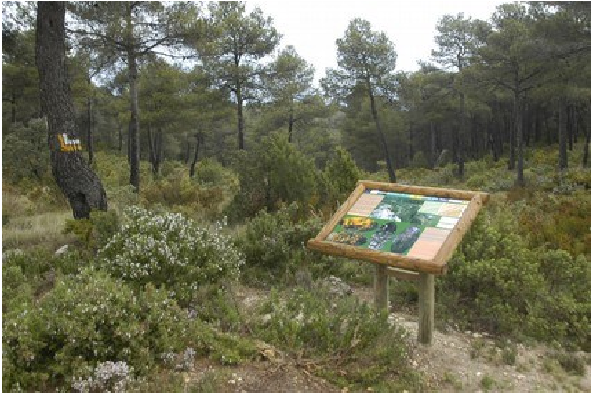
Panell interpretatiu i formacions de coscollar en l'entrada al sender PR-CV-52.