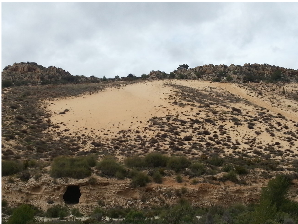
Vista de la microrreserva donde se aprecian las comunidades psammófilas.

http://www.dogv.gva.es/datos/2001/01/30/pdf/2001_670.pdf