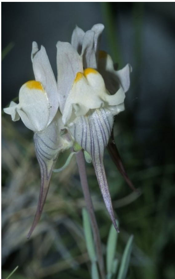
Linaria depauperata subsp. depauperata és un endemisme exclusiu valencià, bastant estès per les muntanyes alcoiano-diàniques.