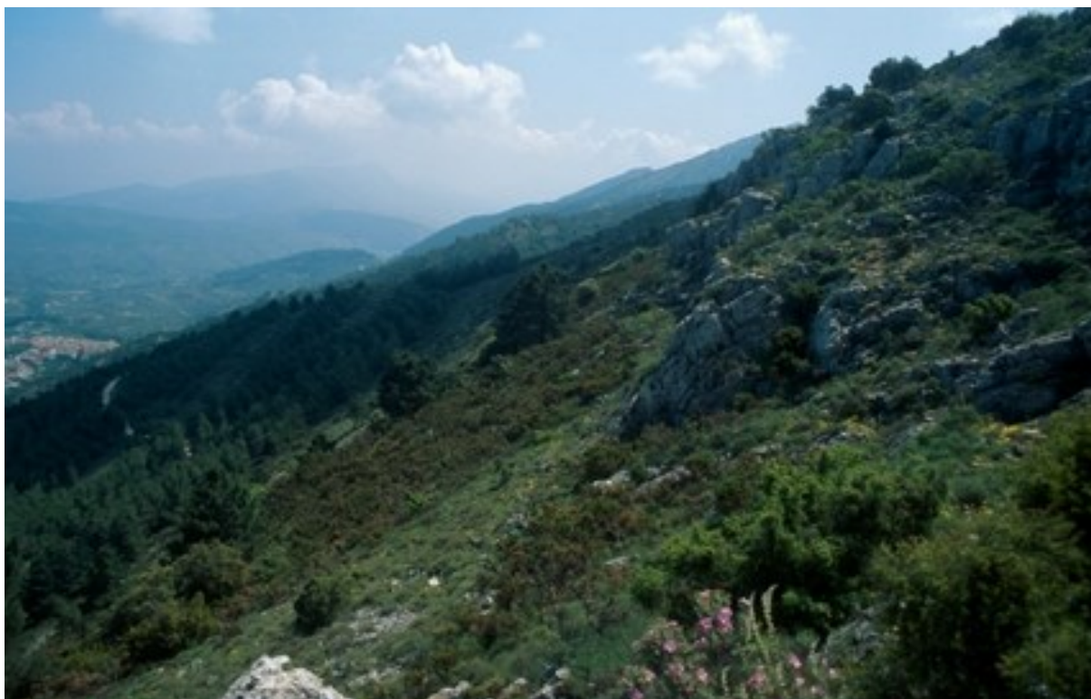
Vista de las comunidades vegetales con formaciones herbosas, matorrales y vegetación rupícola.

http://www.dogv.gva.es/datos/2003/06/09/pdf/2003_6524.pdf