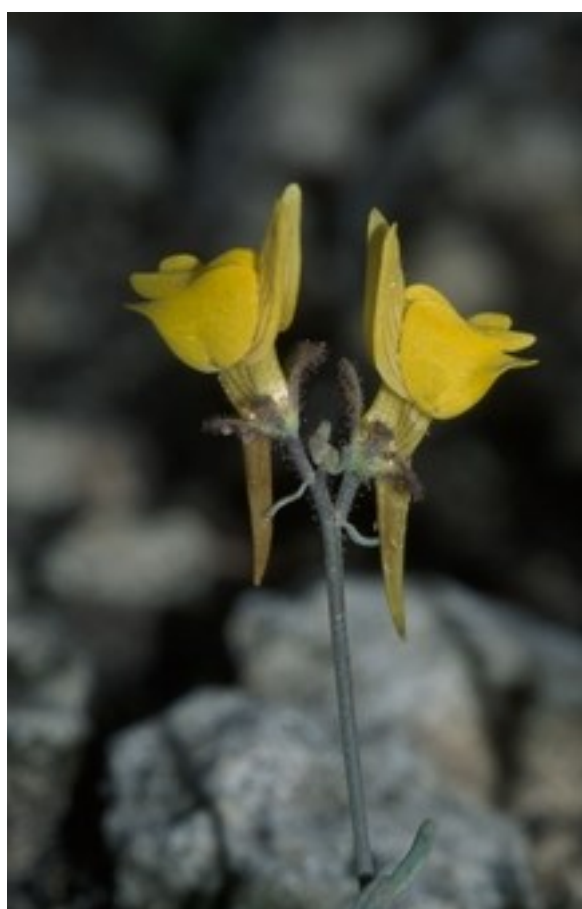
Linaria glauca subsp. aragonensis es un endemismo iberolevantino, con presencia en las montañas setabenses.