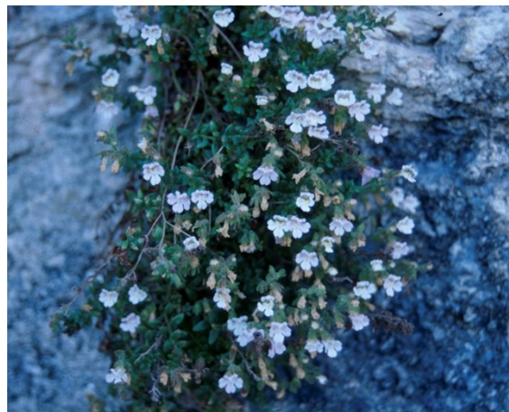
Chaenorhinum crassifolium subsp. crassifolium es otro endemismo iberolevantineo que convive con Sarcocapnos saetabensis en los ambientes rupícolas.