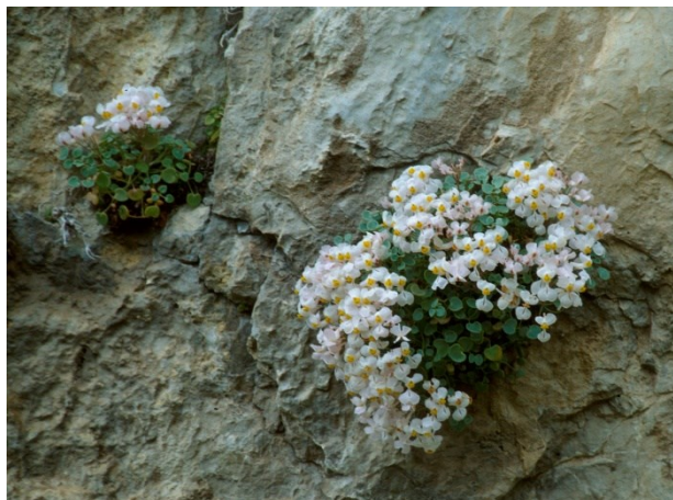
Zapatitos de la virgen ( Sarcocapnos saetabensis ), uno de los endemismos iberolevantineos que colonizan paredes verticales y extraplomos de la microrreserva.

Medicago coronata (R) Ornithogalum bourgaeum (R) Paronychia aretioides (E) Petrorhagia prolifera subsp. velutina (R) Phlomis crinita (E) Reseda valentina (E) Rhamnus borgiae (E) Rhamnus lycioides (E) Sanguisorba minor subsp. minor (R) Sarcocapnos saetabensis (E) Satureja obovata subsp. valentina (E) Saxifraga corsica subsp. cossoniana (E) Scrophularia tanacetifolia (E) Silene mellifera (E) Teucrium buxifolium subsp. hifacense (E, R) Teucrium flavum subsp. glaucum (R) Teucrium ronnigeri subsp. ronnigeri (E) Trigonella gladiata (R)