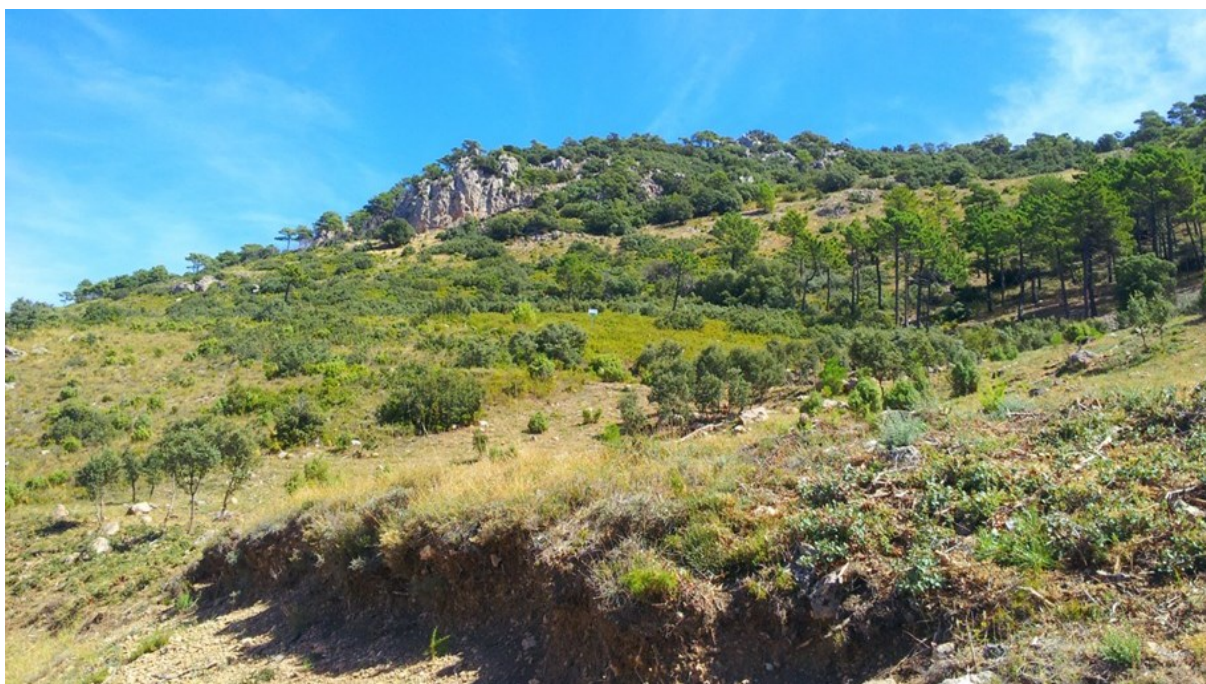
Vista general de la microrreserva, con el hábitat rupícola en la parte superior.