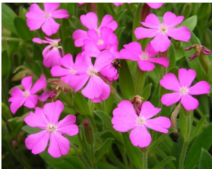
Silene diclinis és una espècie endèmica exclusiva valenciana que va ser descrita de la serra del Castell.

Sarcocapnos saetabensis (E) Satureja obovata subsp. valentina (E) Saxifraga corsica subsp. cossoniana (E) Selaginella denticulata (R) Serapias parviflora (P, R) Silene diclinis (P, E, R) Scrophularia tanacetifolia (E) Smyrniolum olusatrum (R) Teucrium ronnigeri subsp. ronnigeri (E) Urginea undulata subsp. caeculi (E, R) Valerianella eriocarpa (R)