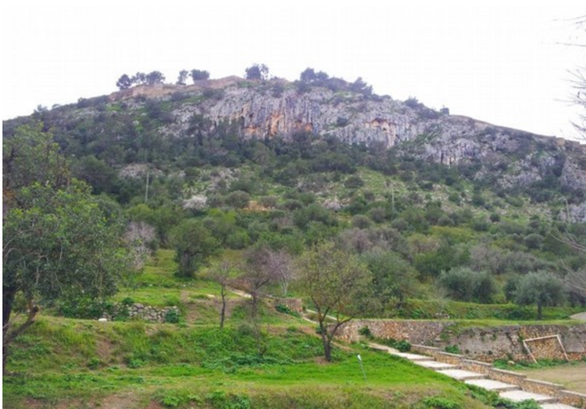
Vista general de la microreserva on es pot observar perfectament l'hàbitat rupícola.