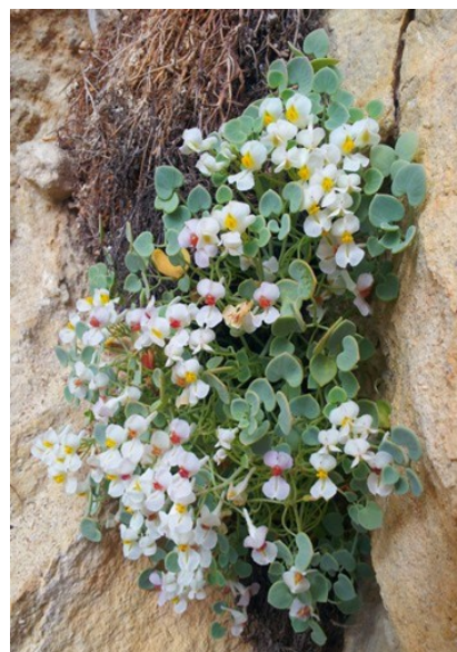
Sarcocapnos saetabensis és un altre dels endemismes característics de la microreserva.

Tipus d'hàbitats (Codi Natura 2000) (Hàbitat prioritari *)