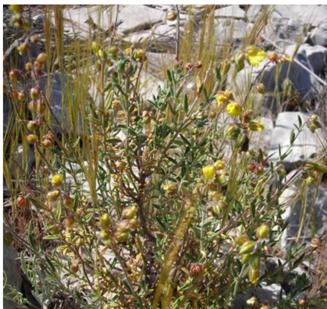
Helianthemum edetanum és una espècie descrita en 2009 que és endèmica de les muntanyes prelitorals de la conca del Túria.