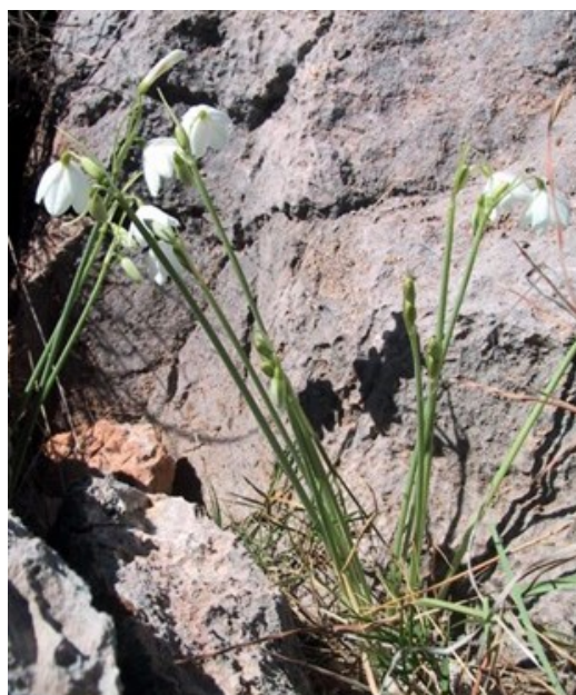
Acis valentina es una planta protegida que está incluida en la categoría de especies Vulnerables .