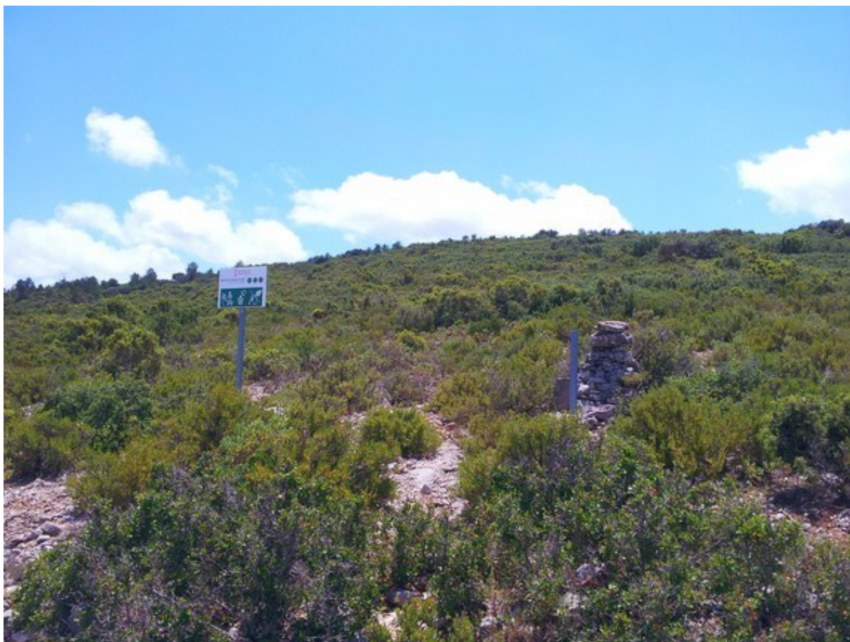
Vista general de la microrreserva con cartel anunciador y piqueta perimetral y aspecto del hábitat 5330 con rodales con vegetación poco densa.