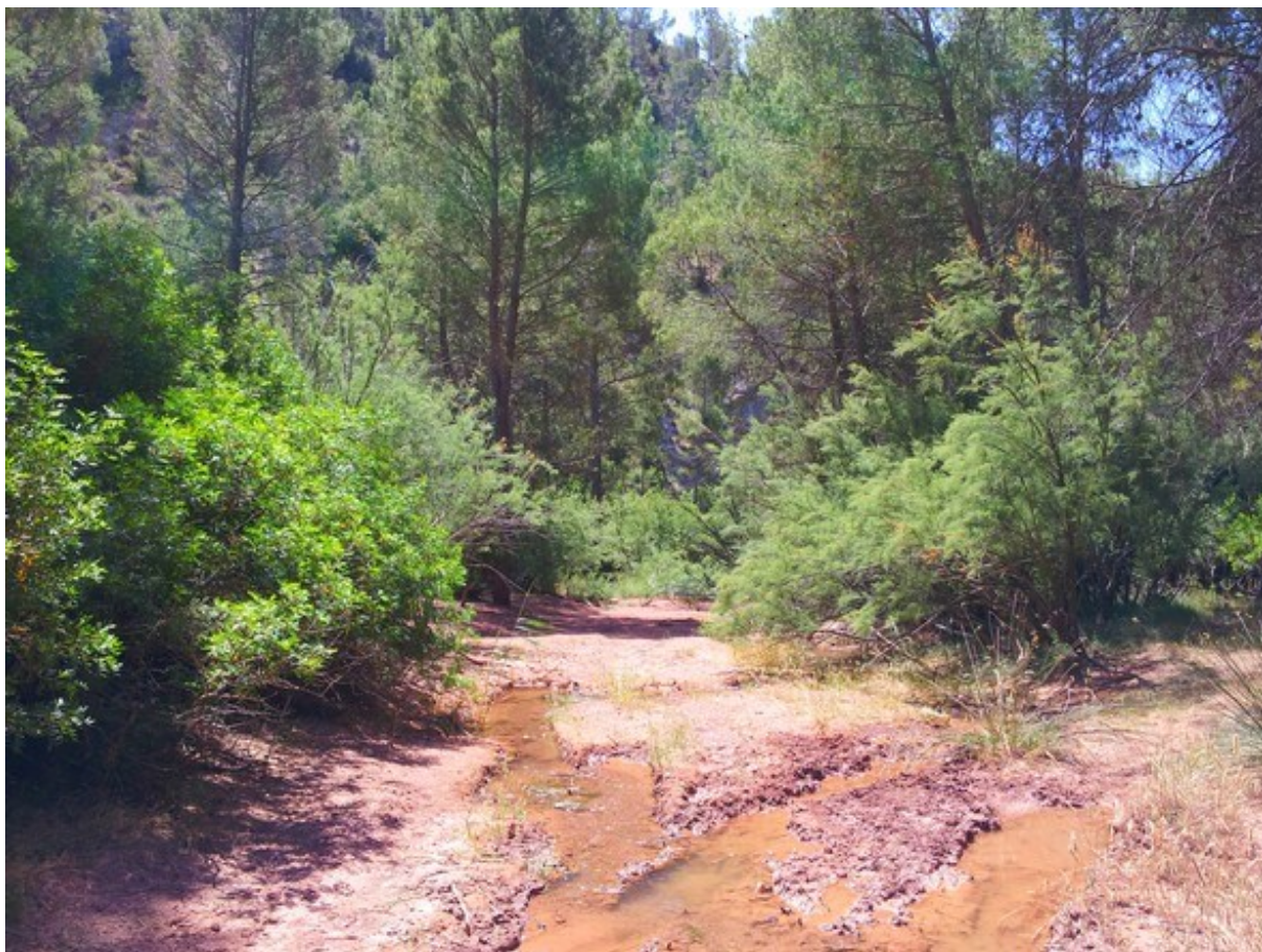
Vista de la rambla con la formación de Tamarix gallica sobre yesos, con el tono rojizo característico de este tipo de material.