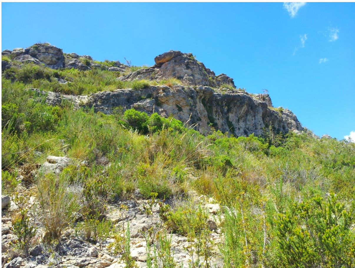
Imatge de la microreserva, en la qual s'observa la brolla calcícola en primer pla i l'hàbitat rupícola en segon pla.