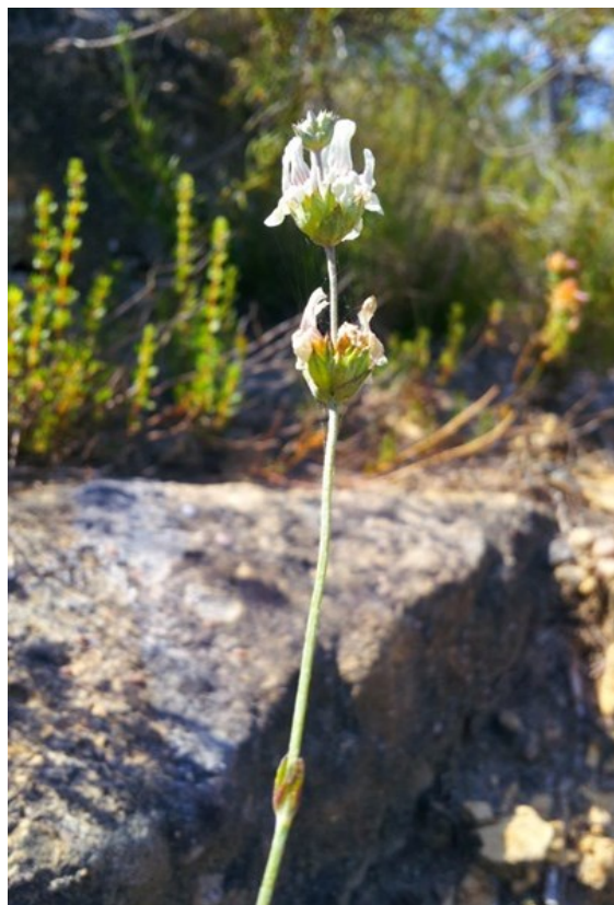
Anthyllis onobrychioides (esquerra) y Sideritis regimontana subsp. edetana (dreta) són dos dels endemismes presents a la microreserva.