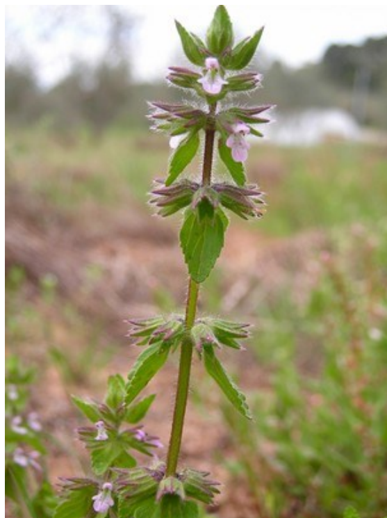
Inflorescència de l'orquídia Neotinea conica , una de les espècies protegides de la microreserva (esquerra) i Stachys arvensis , espècie rara en la flora valenciana lligada a sòls pobres en bases (dreta).