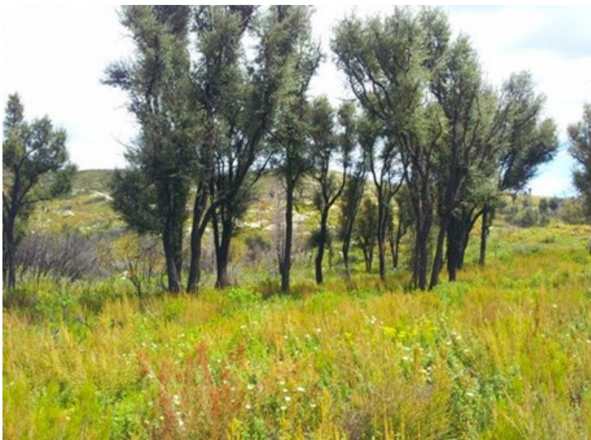
Aspecte dels exemplars de surera ( Quercus suber ) i de la comunitat herbàcia en recuperació després dels efectes de l'incendi de 2018.