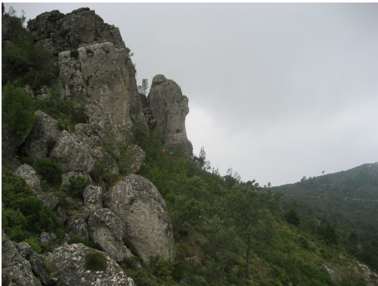
Imatge de l'hàbitat 8210, present als penyals de la part alta de la microreserva.