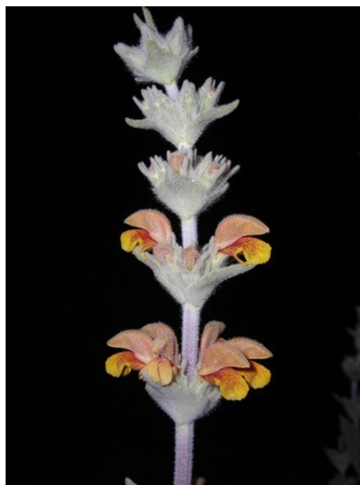
Globularia linifolia subsp. linifolia (esquerra) i Phlomis crinita (dreta) són dos endemismes fàcilment observables a la microreserva.