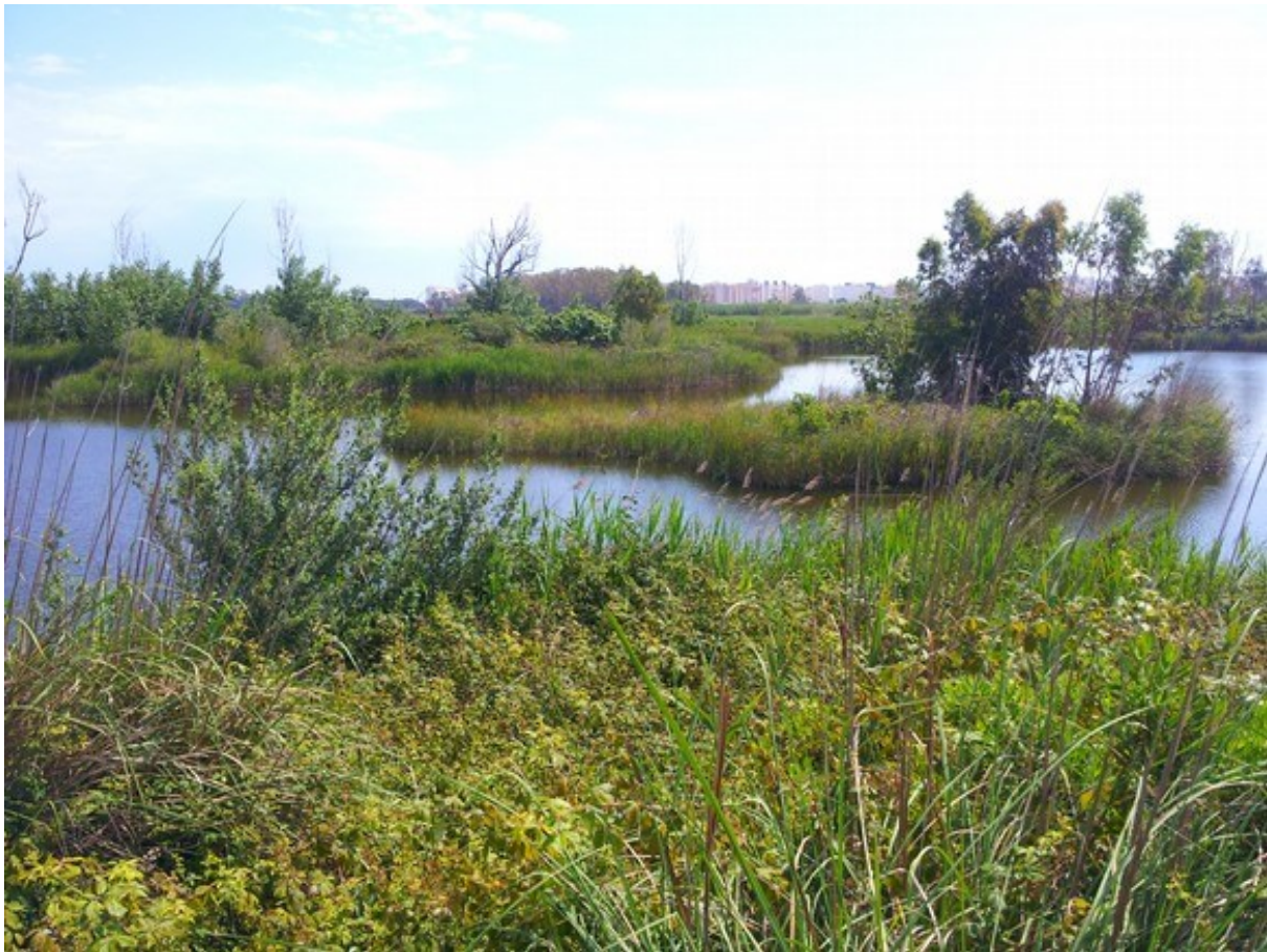
Vista de la microreserva amb l'aspecte després de les obres de remodelació, en la qual s'aprecien les llacunes que constitueixen l'hàbitat 7210.