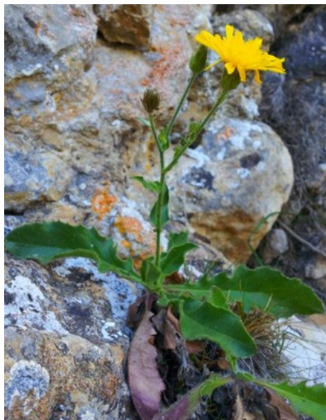
Hyssopus officinalis subsp. canescens (esquerra) i Hieracium amplexicaule (dreta) són dues de les espècies rares que es poden observar a la microreserva.

Tipus d'hàbitats (Codi Natura 2000) (Hàbitats prioritaris*)